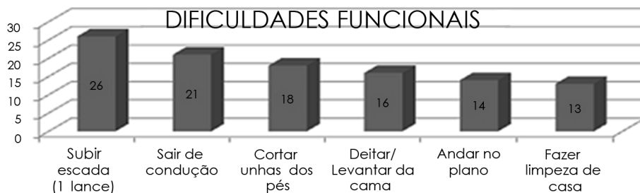
Figura 3. Percentuais correspondentes às dificuldades funcionais dos pacientes incluídos (n = 45)

pacientes com OA são conduzidos a cuidados primários, como orientações, tratamento medicamentoso e mudanças no ambiente domiciliar/trabalho de modo que intervenções simples são necessárias. 15