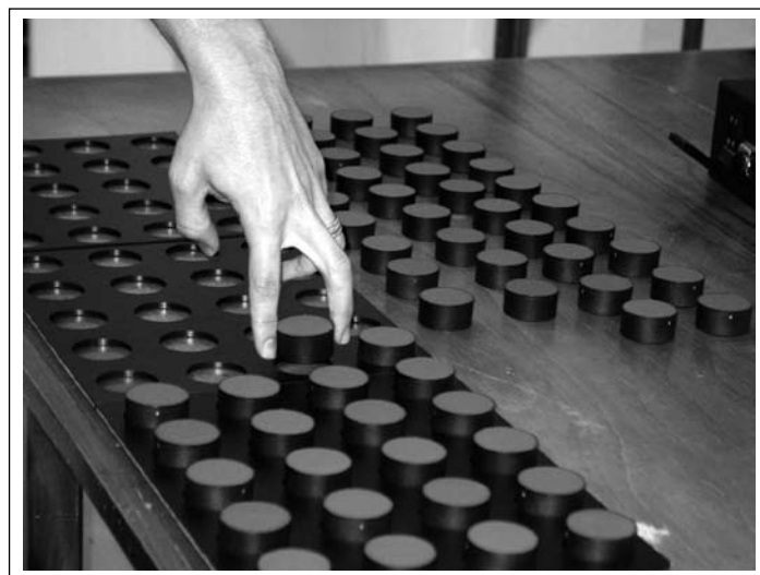
Figura 4 Encaixe das peças realizado com prensão entre II e III dedos.