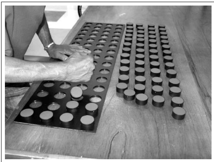
Figura 1 Encaixe das peças realizado com a borda ulnar da mão.

Ao estipularmos a espera de 10 minutos (600 segundos) para cada tentativa, e contabilizarmos o número de peças encaixadas pelo paciente, garantimos que o tempo máximo de espera não ultrapas-