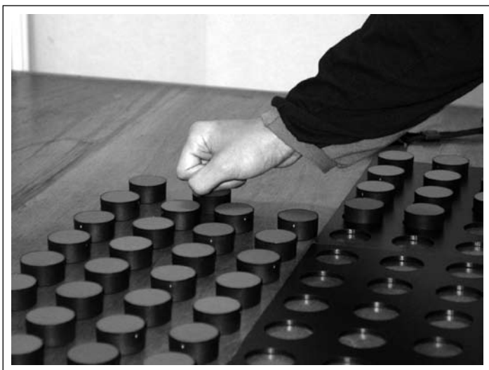
Figura 2 Deslizamento das peças realizado com o dorso dos dedos e mão fechada.